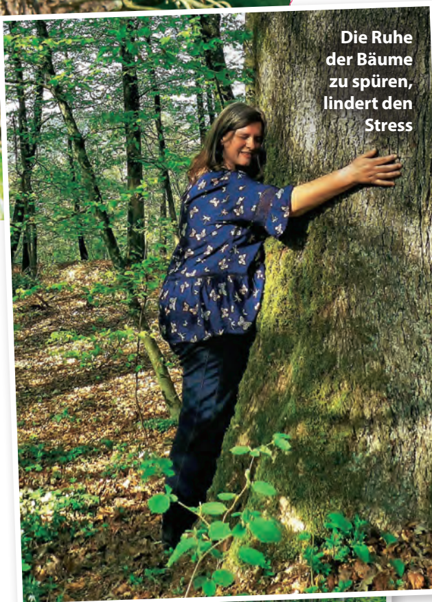
Die Ruhe der Bäume zu spüren, lindert den Stress